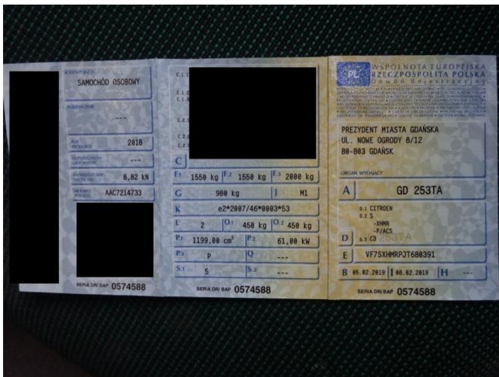
Fot. 18. Dowód rejestracyjny.