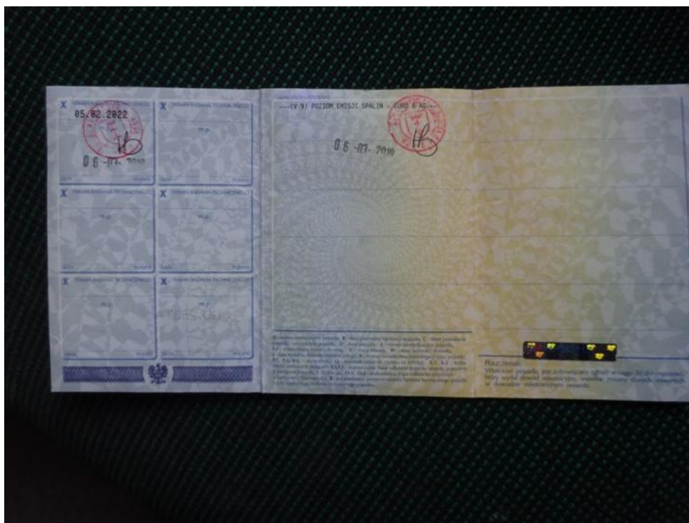
Fot. 19. Dowód rejestracyjny.